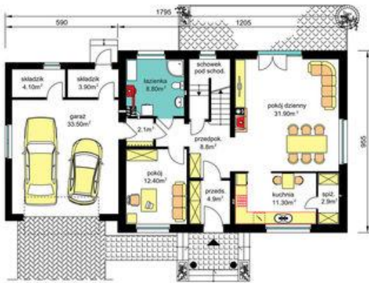
PARTER - wariant z ogrzewaniem gazowym (rysunki zawarte w projekcie) Pu-81.00m 2 , Pg-43.60m 2