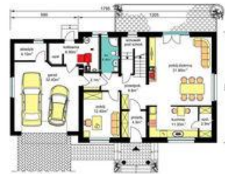
PARTER Pu-76.60m 2 , Pg-47.50m 2