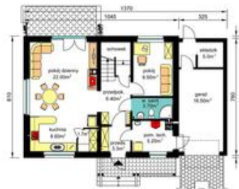
PARTER - wariant z ogrzewaniem gazowym (rysunki zawarte w projekcie) Pu-55.20m 2 , Pg-26.70m 2