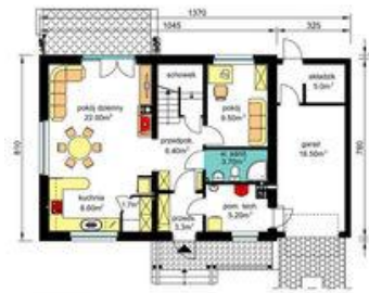
PARTER - wariant z ogrzewaniem gazowym (rysunki zawarte w projekcie) Pu-55.20m 2 , Pg-26.70m 2