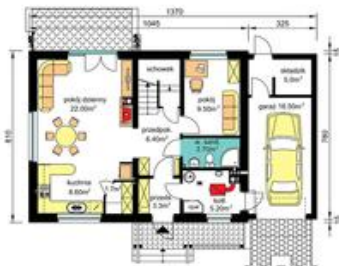
PARTER - z kotłownią na paliwo stałe Pu-55.20m 2 , Pg-26.70m 2