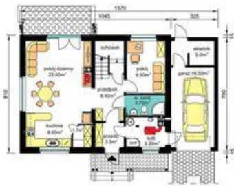
PARTER - z kotłownią na paliwo stałe Pu-55.20m 2 , Pg-26.70m 2