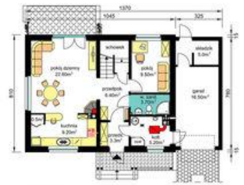
PARTER - wariant usytuowania kominka (dostępne rysunki zamienne) Pu-55.20m 2 , Pg-26.70m 2