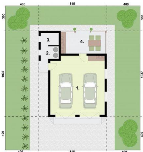
Rzut przyziemia 1. Garaż 45.1m 2 2. Weranda 13.87m 2 3. Skład na drewno 3.12m 2 4. Skład na odpady 3.12m 2