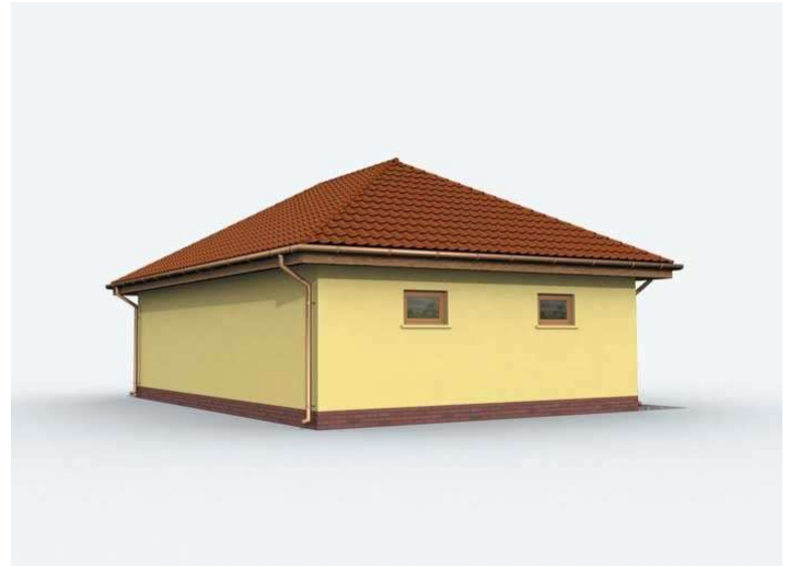
Przyziemie 1. Garaż 38.3m 2 2. Garaż 24.8m 2