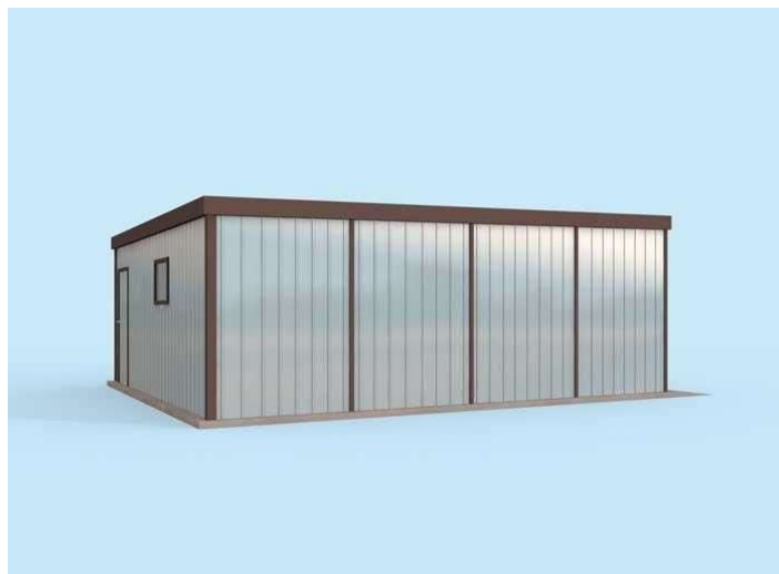
Rzut przyziemia 1. Garaż 38.53m 2