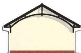
ELEWACJA BOCZNA LEWA