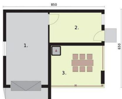
Rzut przyziemia 1. Garaż 21.12m 2 2. Pomieszczenie gospodarcze 10.9m 2 3. Weranda 14.33m 2