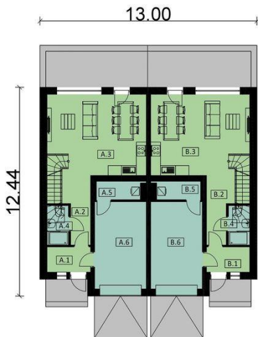
Rzut parteru BUDYNEK A