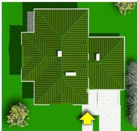
7 Wymiary domu - 14,78m x 12,86m 8 Minimalne wymiary działki - 21,78m x 21,86m