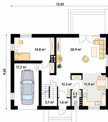
parter wiatrołap 1.6 hol 12.3 salon 28.9 kuchnia/jadalnia 11.9 wc 2.3 schody 5.7 pokój 14.8 garaż 17.2