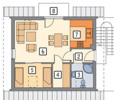
rzut poddasza 2. przedsionek 2.30 m 2 3. łazienka 2.60 m 2 4. garderoba 2.10 m 2 5. sypialnia 4.50 m 2 6. pokój dzienny 16.90 m 2 7. aneks kuchenny 3.30 m 2 8. balkon 2.60 m 2