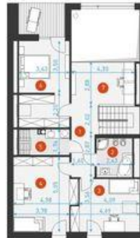
Rzut poddasza 67,7 m 2