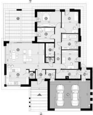
HomeKONCEPT 26 wariant 4 wersja podstawowa zagospodarowanie terenu