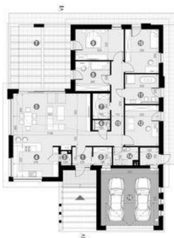
HomeKONCEPT 26 wariant 3 wersja podstawowa zagospodarowanie terenu