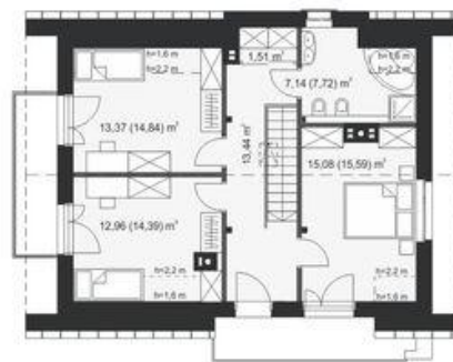
PODDASZE pow. użytkowa: 63,50 m 2 pow. podłogi: 67,49 m 2