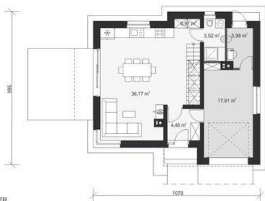
PARTER pow. użytkowa: 45,74 m 2 + 17,91 m 2 garaż + 3,98 m 2 kotłownia pow. podłogi: 67,63 m 2