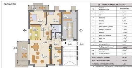
Projekt domu AJR 23 - rzut parteru